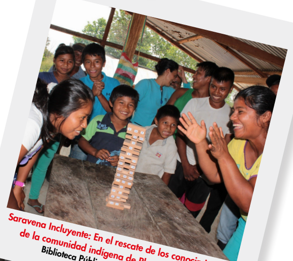
Saravena Inuyente: En el rescate de los conocimientos de la comunidad indígena de Playas del Bojaba Biblioteca Pública Abel Betancourt Ruiz Saravena (Arauca)