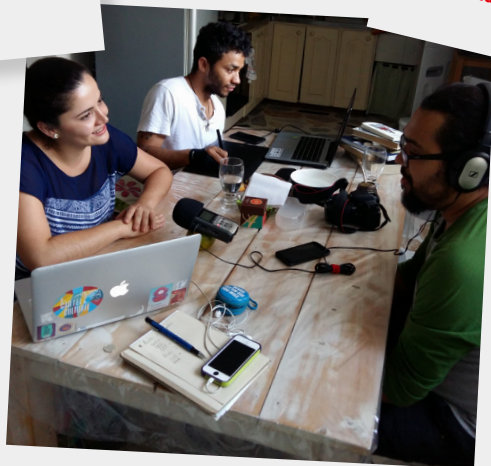
Booktuber a la mano Biblioteca Pública Popular No. 2 Medellín (Antioquia)