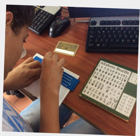
Creando soluciones para los que tienen discapacidad "CSPD" Biblioteca Pública Barrial Fernando Gómez Martínez Medellín (Antioquia)