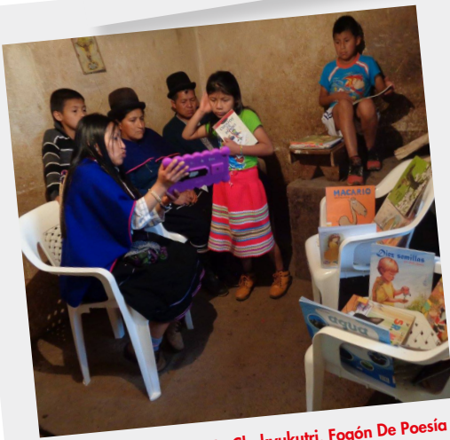
Wamt ka Kusrenkun Na Chakyukutri. Fogón De Poesía Biblioteca Pública Misak Misak Ala Kusrei Ya Guambia - Silvia (Cauca)