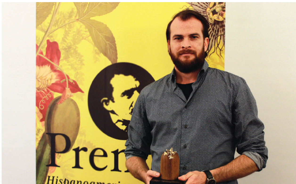
El escritor español Alejandro Morellón Mariano, ganador del Premio Hispanoamericano de Cuento 2017.

Todos estos avances fueron posibles gracias a una inversión histórica del Ministerio de Cultura, lo cual representa una apuesta sin precedentes en el ámbito de las bibliotecas públicas de nuestro país, y al respaldo de diferentes organizaciones de cooperación internacional como la Fundación Bill y Melinda Gates y la Agencia Coreana para la Cooperación Internacional – Koica, las que confiaron en la importancia de las bibliotecas como agentes de transformación para Colombia.