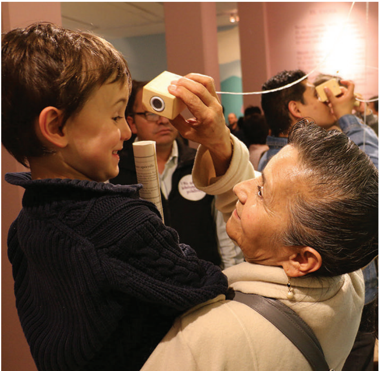
Exposición 'María, el paraíso en contienda', realizada en el marco del Año Jorge Isaacs 2017.

Que la cultura llegue a la mayoría de regiones de nuestra complicada geografía, que a los ciudadanos se les garanticen la lectura y el acceso a las artes, y que se piense en acciones para la apropiación de nuestro patrimonio, no es nada distinto a una aspiración verdaderamente democrática en tiempos de paz.